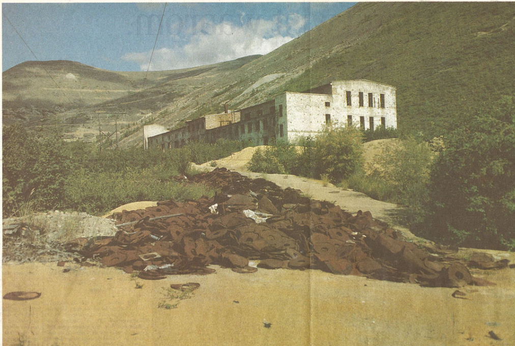
De fabriek in Botoegtsjak, waar het uranium werd verwerkt.